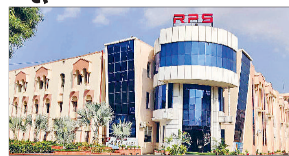
महेंद्रगढ़। आरपीएस स्कूल का भवन।

परीक्षा में कक्षा तीसरी से 11वीं तक के बच्चे भाग ले सकेंगे। परीक्षा के आधार पर विद्यार्थियों को