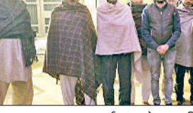
नारायणगढ़। धरना प्रदर्शन करते गन्ना किसान।