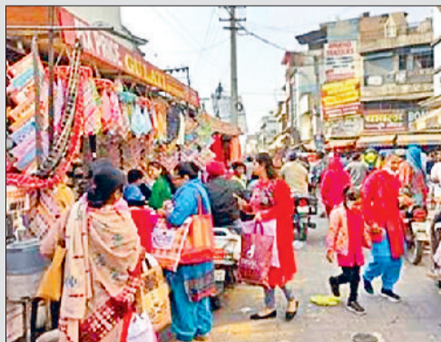
अंबाला। होलसेल कपड़ा मार्केट में देव समाज कॉलेज रोड का दृश्य।

सिंह ने कहा कि अंबाला छावनी में मलबे की रजिस्ट्री होती थी जबकि रजिस्ट्री के मलबे के मूल्य में भूमि की कीमत जोड़कर कलेक्टर रेट लगाया जाता है। जनता लुट रही है और सभी चौकीदार मौन हैं। कहा कि कलेक्टर रेट में ये वृद्धि से कुछ नेताओं के निजी फायदे हो सकती है लेकिन आमजन को इससे नुकसान ही होगा। कहा कि ग्रामीण क्षेत्र की रजिस्ट्री में तो सरकार ने पहले ही स्टॉप ड्यूटी जो 3% थी उसे 5% कर दिया है और जो 5% थी उसे 7% कर दिया है। यह वृद्धि पहले ही किसानों को प्रभावित कर रही है। सरकार से मांग की कि खेती-बाड़ी की जमीन के लिए स्टॉप ड्यूटी सबके लिए 3% की जाए और प्रस्तावित कलेक्टर रेट लागू किए जाने से पहले उस क्षेत्र के वास्तविक रेट जरूर चेक किया जाए।