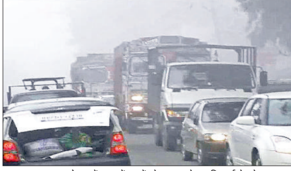
यमुनानगर। घना कोहरा में सड़कों पर रंगते हुए चलते हुए दिखाई दे रहे वाहन।

शनिवार को दिन भर नहीं हुए सूर्य देव के दर्शन, बढ़ती ठंड में मूंगफली का बाजार हुआ गर्म, जिले का तापमान गिरकर न्यूनतम पहुंचा छह डिग्री सेल्सियस