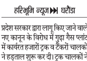
प्रदेश सरकार द्वारा लागू किए जाने वाले नए कानून के विरोध में गुड़ा गैस प्लांट में कार्यरत हजारों ट्रक व टैंकरों चालकों ने हड़ताल शुरू कर दी।

प्रदेश सरकार द्वारा लागू किए जाने वाले नए कानून के विरोध में गुड़ा गैस प्लांट में कार्यरत हजारों ट्रक व टैंकरों चालकों ने हड़ताल शुरू कर दी। ट्रक चालकों ने चक्का जाम करते हुए गुड़ा गैस प्लांट के गेट के सामने धरना प्रदर्शन करते हुए प्रदेश सरकार के खिलाफ जमकर नारेबाजी की। इस कानून को लेकर आमजन में भी रोष है। शनिवार को गुड़ा गैस प्लांट में कार्यरत हजारों ट्रक में टैंकर चालक गैस प्लांट के मेन गेट के सामने एकत्रित हो गए। उन्होंने गेट के सामने टेंट लगाकर धरना प्रदर्शन शुरू कर दिया।