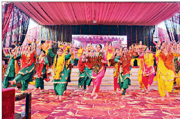
अंबाला। कार्यक्रम में रंगारंग प्रस्तुतियां देते छात्र व कार्यक्रम का शुभारंभ करते मुख्यअतिथि।

रथ पर श्री कृष्ण द्वारा अर्जुन को गीता उपदेश देते हुए रथ पर झांकी प्रस्तुत की गई। स्कूल के बैंड द्वारा विद्यालय के प्रांगण द्वार पर लाकर छात्रों द्वारा तिलक लगाकर भव्य स्वागत किया। गायत्री मन्त्र द्वारा ज्योति प्रज्वलन करते हुए डी ए वी गान गाकर कार्यक्रम का प्रारंभ किया गया। सर्वप्रथम शिव वंदना, अंग्रेजो का भारत में आगमन, मंगल